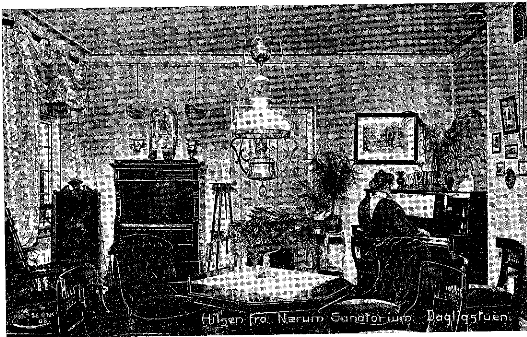
42 Dagligstuen på Sanatoriet, fot 1910

Danmark og Norge. Den trivedes godt i en årrække, men føltes alligevel snart for lille, især da det ønske opstod hos ledelsen at knytte et større landbrug til den, hvor eleverne kunne få en mere omfattende og grundigere undervisning i mark- og havebrug end den, der kunne præsteres på de 2 tdr. land i Nærum. Da så i sommeren 1929 den smukt og højtbeliggende »Kirkeskovgård« ved Daugård øst for Vejle var averteret til salg, handlede Adventistsamfundet med vanlig beslutsomhed, energi og offervilje, købte ikke alene gården med alle dens tiliggender, men også 18 tdr. land fra en nabo-gård for at opnå strandret ved Vejle fjord og begyndte samme efterår opførelsen af et mægtigt bygningskompleks, der var bereg-