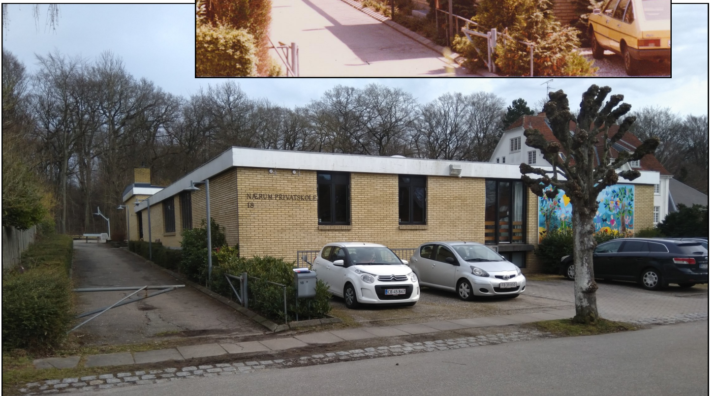
Først Adventisternes Privatskole Siden Nærum Privatskole