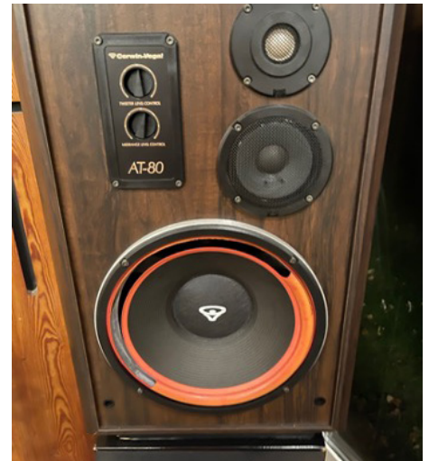
Den defekte højttaler foran i kirkesalen er blevet repareret.