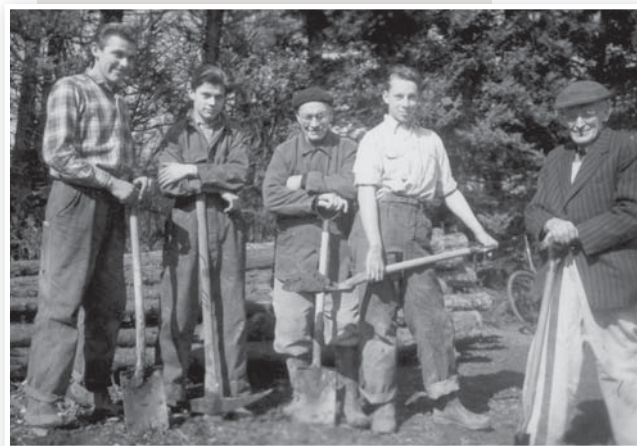
Et hold bygningsarbejdere (1954).

Menigheden var aktiv med møder både fredag og lørdag aften, og hver onsdag aften var der bedemøde. Under krigen var det svært at mødes, specielt i vinteren 1943/44, hvor tyskerne havde indført spærretid.