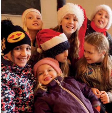
Spejdernes juletur til Kongelejren.