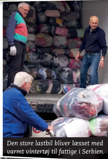
Den store lastbil bliver læsset med varmt vintertøj til fattige i Serbien.